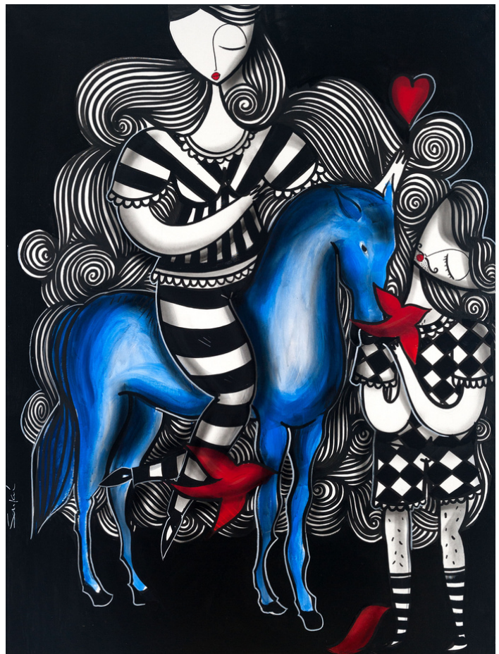
MIXED MEDIA ON CANVAS 120 X 90