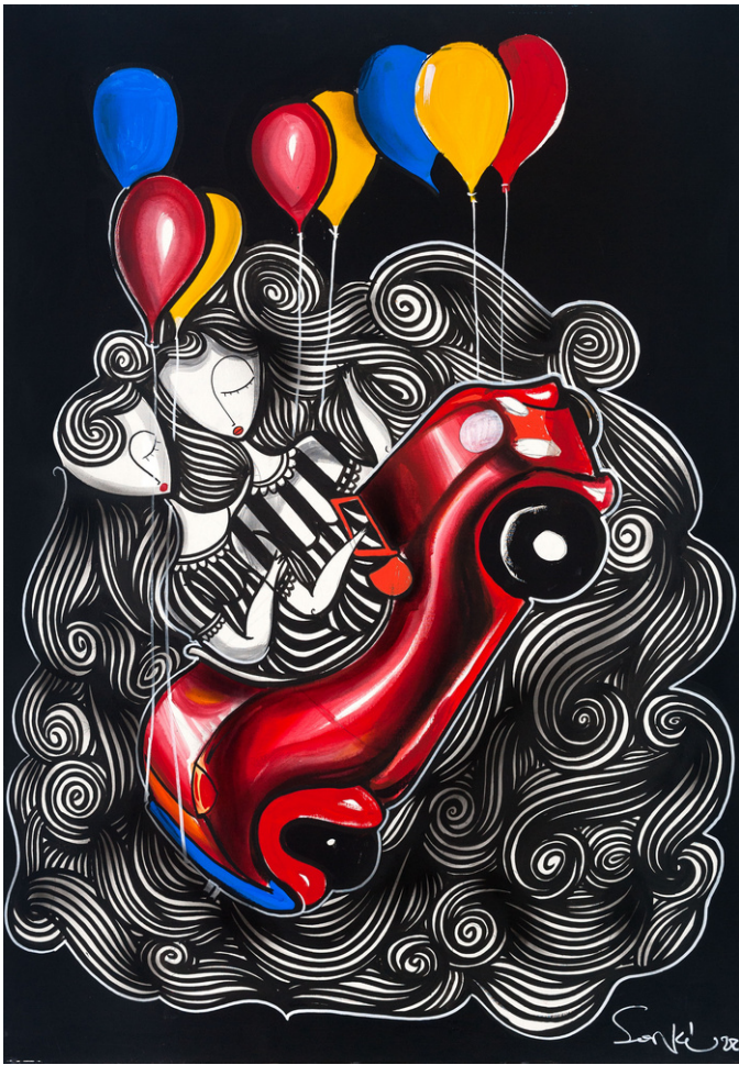
MIXED MEDIA ON CANVAS 100 X 70