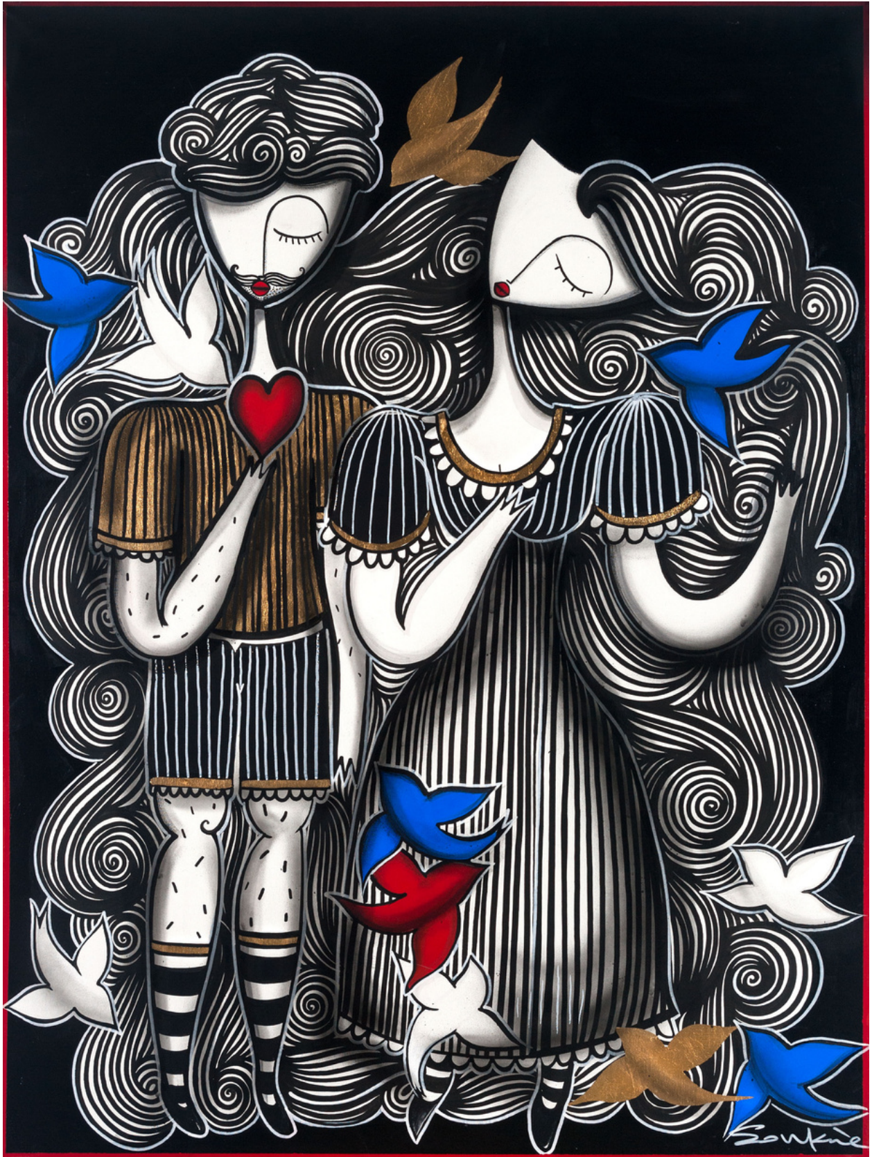
MIXED MEDIA ON CANVAS 120 x 90