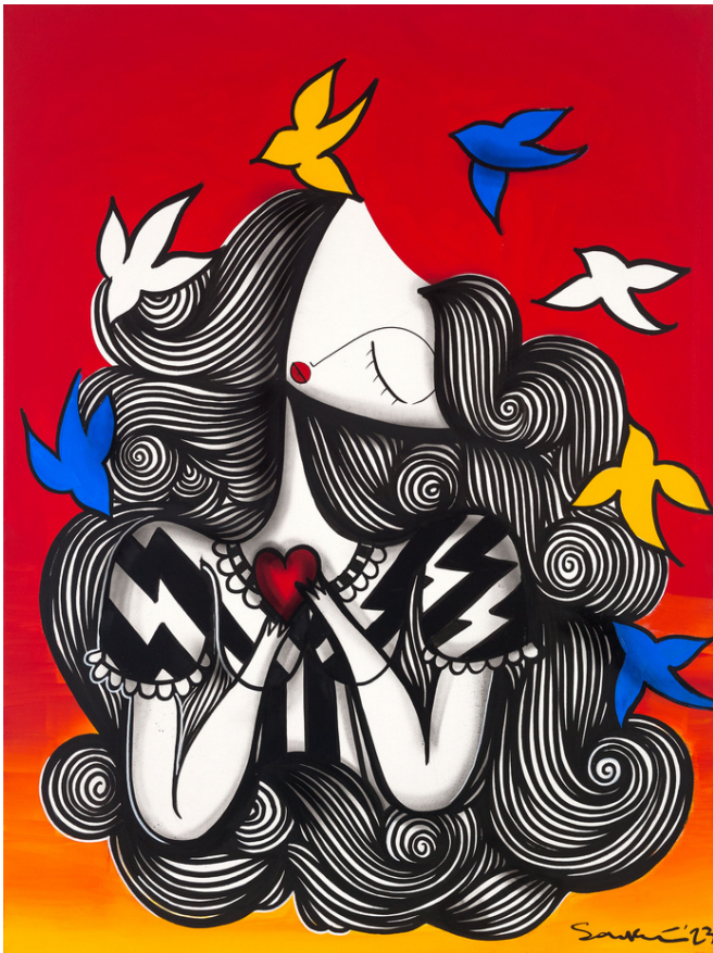
MIXED MEDIA ON CANVAS 120 x 90