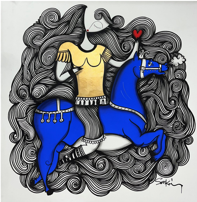
MIXED MEDIA ON CANVAS 170 X 175