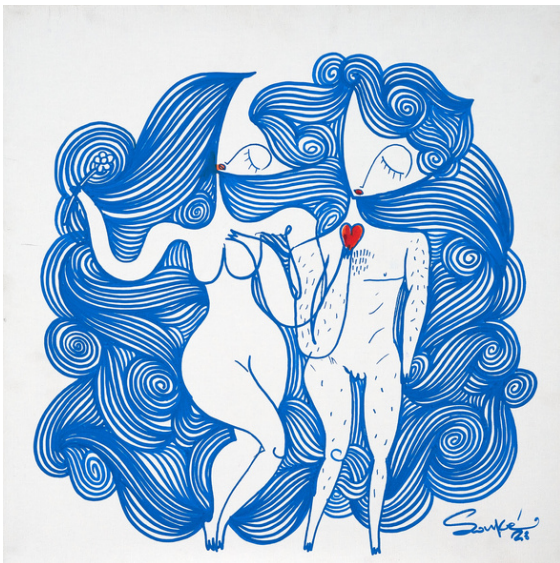
MIXED MEDIA ON CANVAS 50 X 50