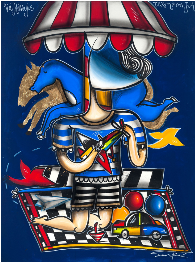
MIXED MEDIA ON CANVAS 120 X 90