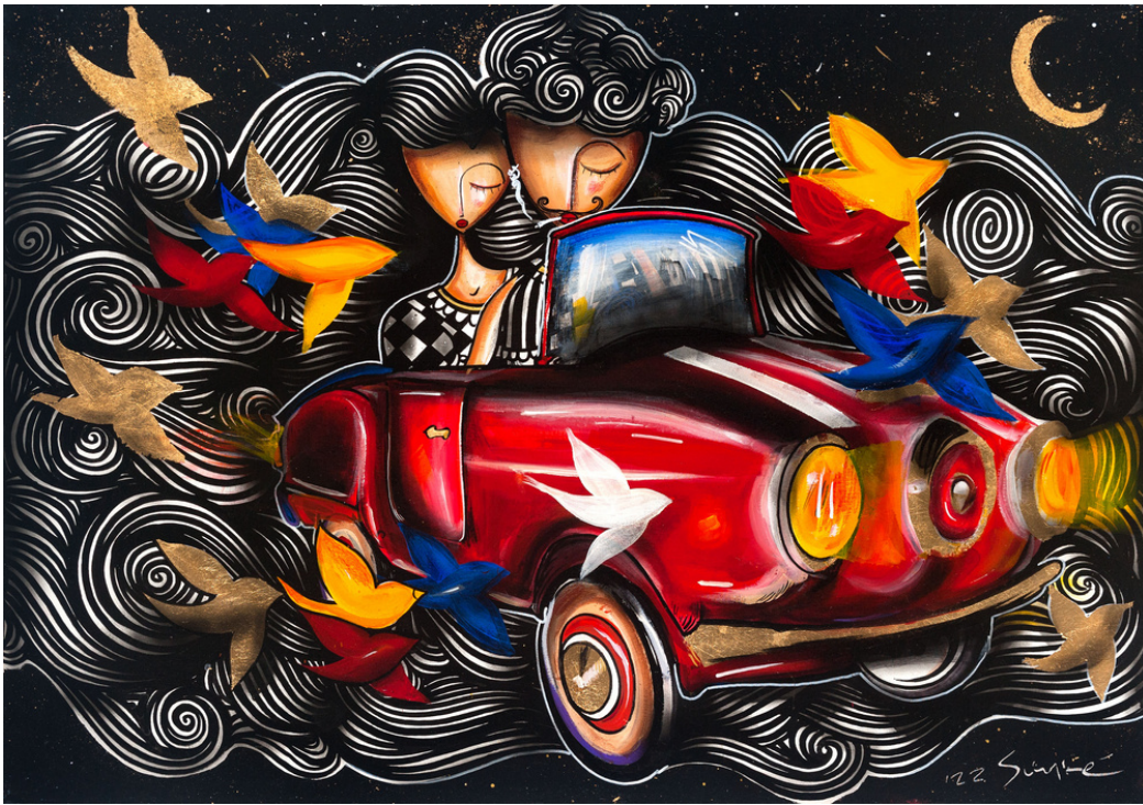
MIXED MEDIA ON CANVAS 70 X 100