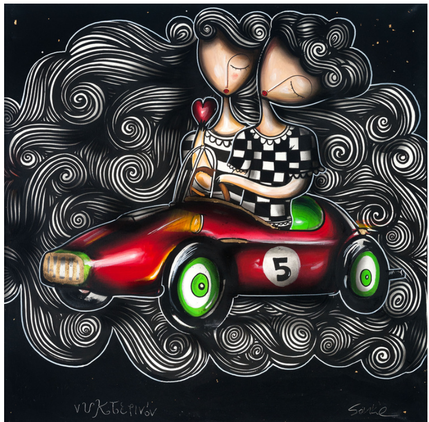
MIXED MEDIA ON CANVAS 100 X 100