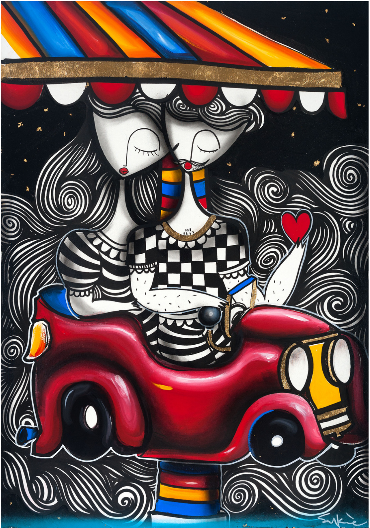
MIXED MEDIA ON CANVAS 100 X 70