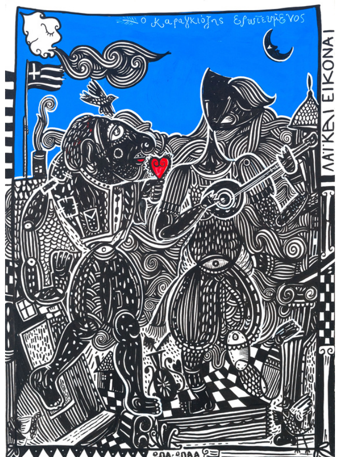
MIXED MEDIA ON CANVAS 70 X 50