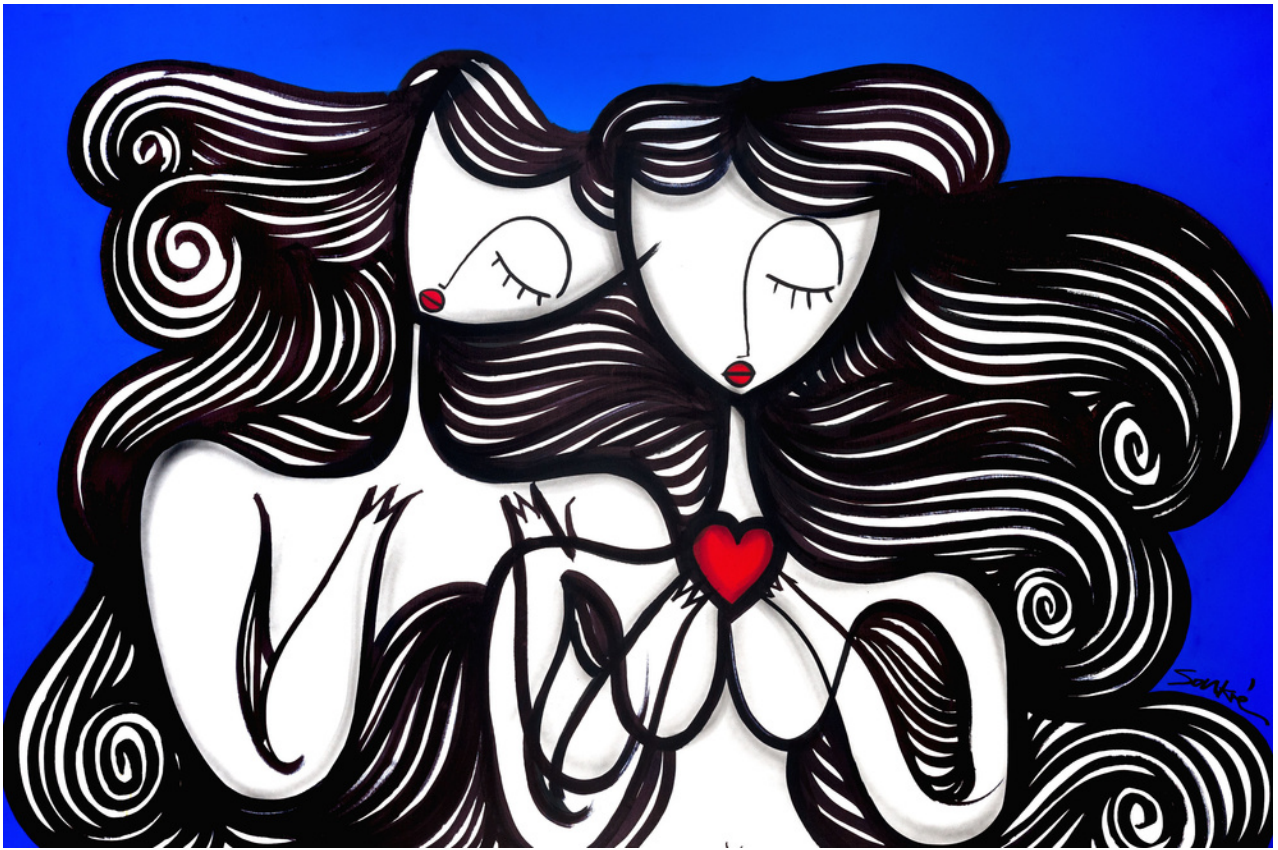
MIXED MEDIA ON CANVAS 130 X 200