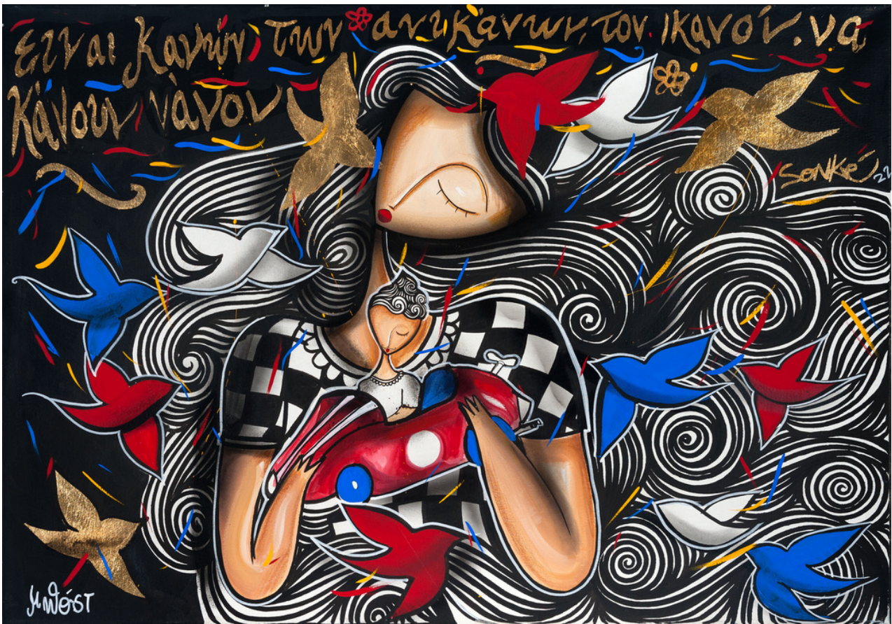
MIXED MEDIA ON CANVAS 70 x 100