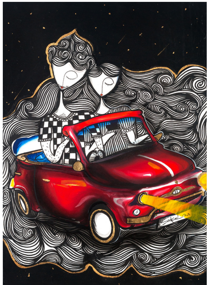
MIXED MEDIA ON CANVAS 70 X 50