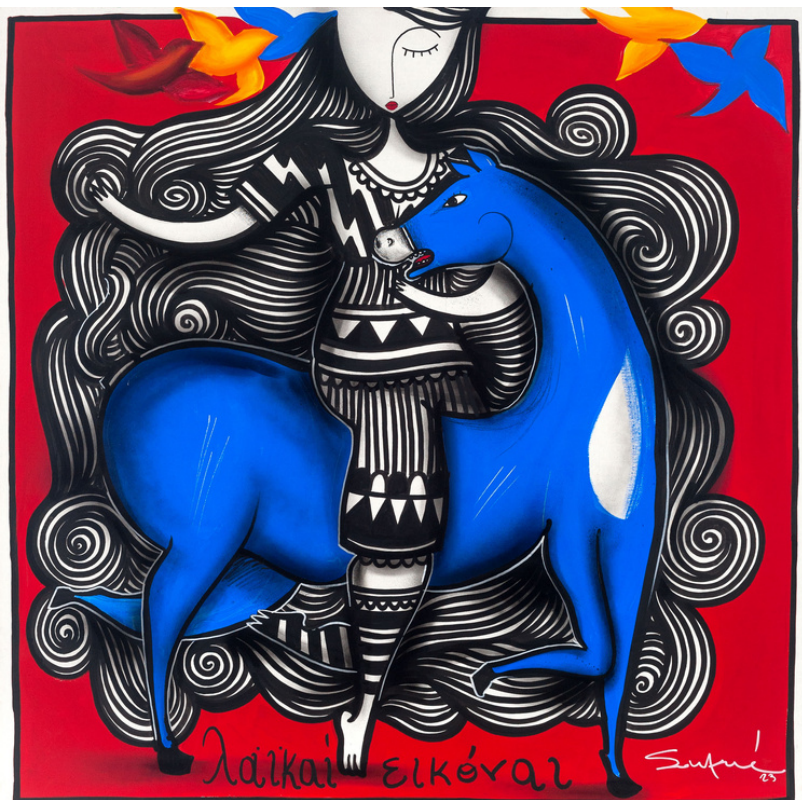
MIXED MEDIA ON CANVAS 100 x 100