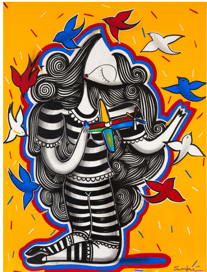
MIXED MEDIA ON CANVAS 120 x 90