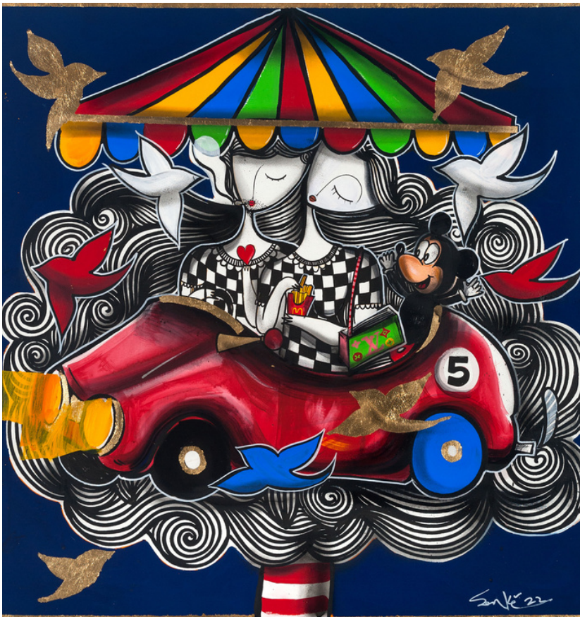
MIXED MEDIA ON CANVAS 100 x 100