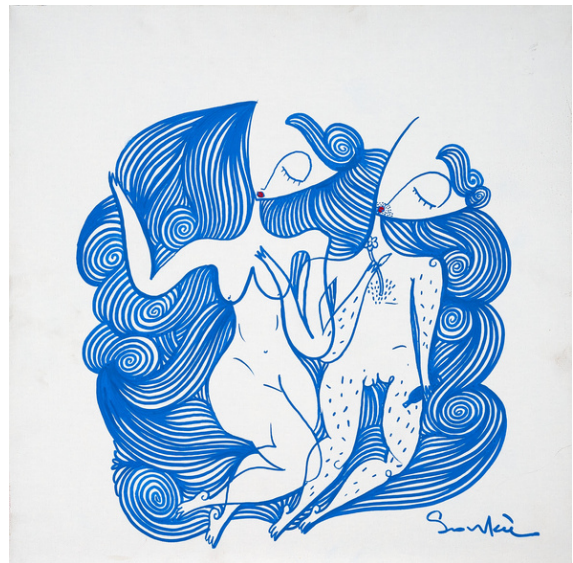
MIXED MEDIA ON CANVAS 50 X 50