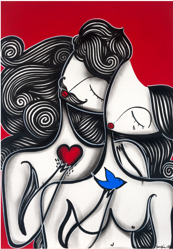
MIXED MEDIA ON CANVAS 100 x 70