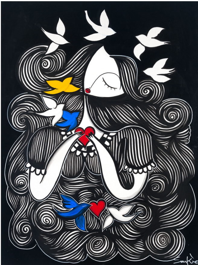
MIXED MEDIA ON CANVAS 120 x 90