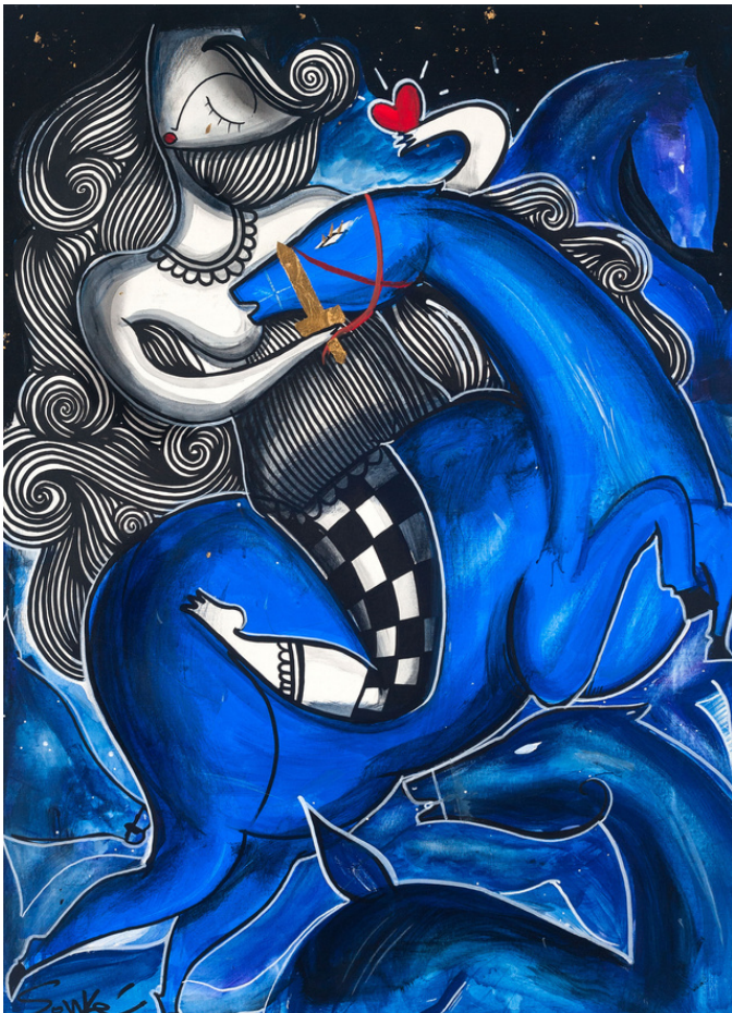
MIXED MEDIA ON CANVAS 70 X 50