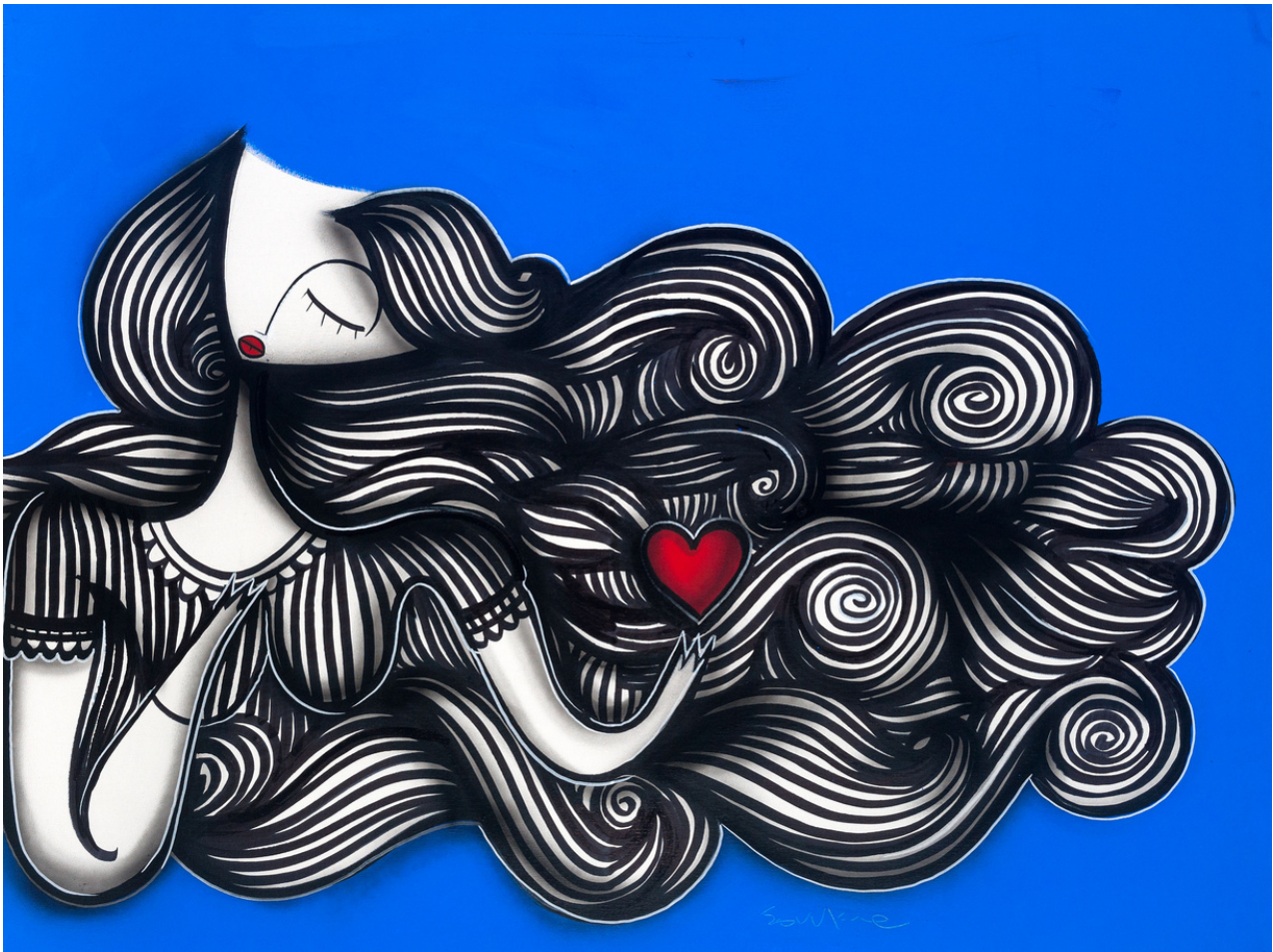
MIXED MEDIA ON CANVAS 90 X 120