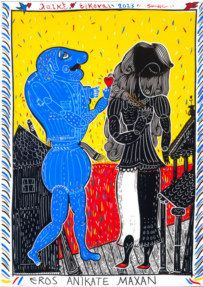
MIXED MEDIA ON CANVAS 70 X 50