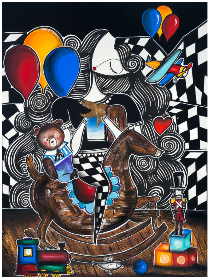
MIXED MEDIA ON CANVAS 120 X 90